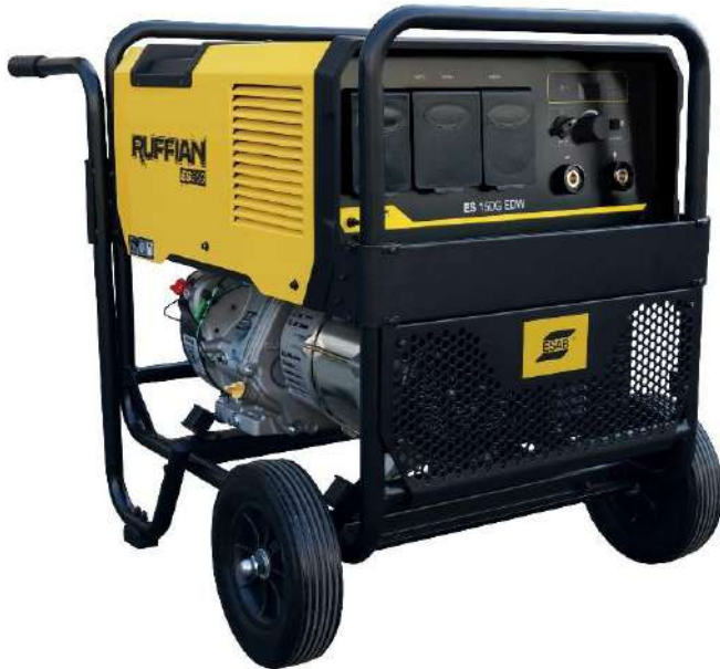
Ruffian ES 150G EDW

La soldadora Ruffian ES 150G es una máquina de soldar con electrodos de CC y un generador de CA ligeros, potentes y todo en uno combinados. Como soldadora, Ruffian utiliza tecnología inverter para proporcionar hasta 150 A de potencia de soldadura confiable con un ciclo de trabajo del 60 % en un arco muy estable que ayuda a evitar el trabajo de repaso. Como generador de CA, la soldadora Ruffian utiliza un motor Kohler de 14 HP® para ofrecer una potencia de arranque de hasta 4,5 kW. Los tomacorrientes de 120 y 240 V CA brindan versatilidad para el funcionamiento de luces, amoladoras, herramientas manuales, e incluso cortadoras de plasma para aplicaciones ligeras y soldadoras MIG/TIG, y para usar como respaldo en casos de emergencia.