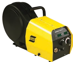
Warrior Feed 304