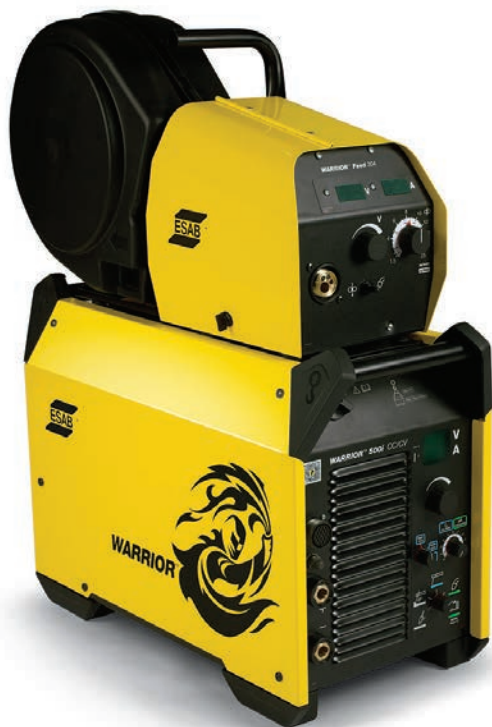
Warrior 500i con alimentador de alambre Warrior Feed 304.

La Warrior 500i es una máquina para soldar confiable y multiproceso diseñada para una productividad de alto desempeño produciendo hasta 500 amperios y con excelentes características de arco.