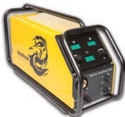
Warrior YardFeed 200