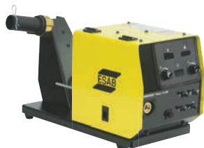
Warrior Feed 404HD