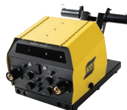
Warrior Feed Dual 304