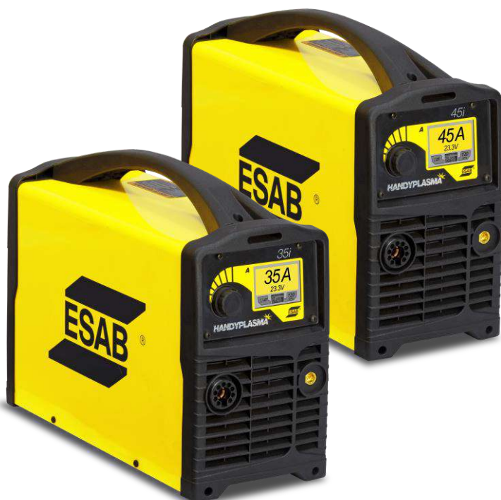
HandyPlasma 35i / 45i

Equipo inversor para corte plasma manual, ligera y portátil, con alimentación monofásica 220V 50/60Hz. Fácil de usar, con panel LCD a colores y todos los ajustes se pueden realizar con sólo un botón. No necesita ajustar el gas – la máquina detecta automáticamente la presión de entrada y salida. Sistema automático de purga del gas después del corte aumenta la vida útil de los consumibles.