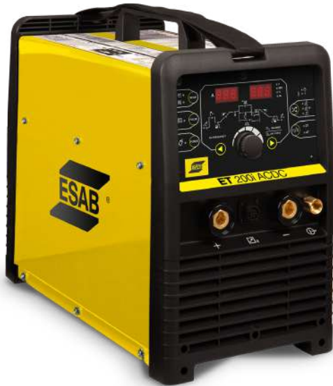
ET 200i AC/DC

La ET200i AC/DC es una máquina completa, con todos los recursos para soldadura TIG y Electrodo.