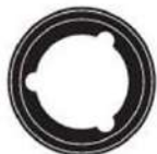
Rodillo de alimentación de doble ranura